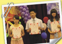
文山區語文競賽頒獎