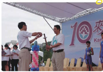
文 / 701楊皓丞