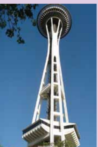
Space needle 太空針，西雅圖當地著名的景點