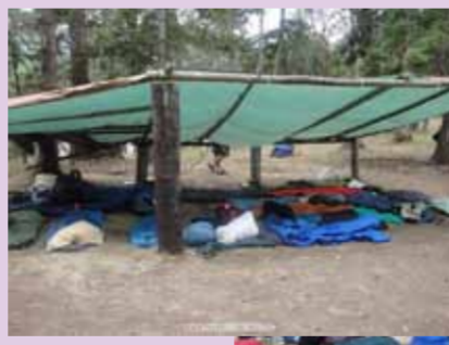
YMCA夏令營 - 我們睡的地方